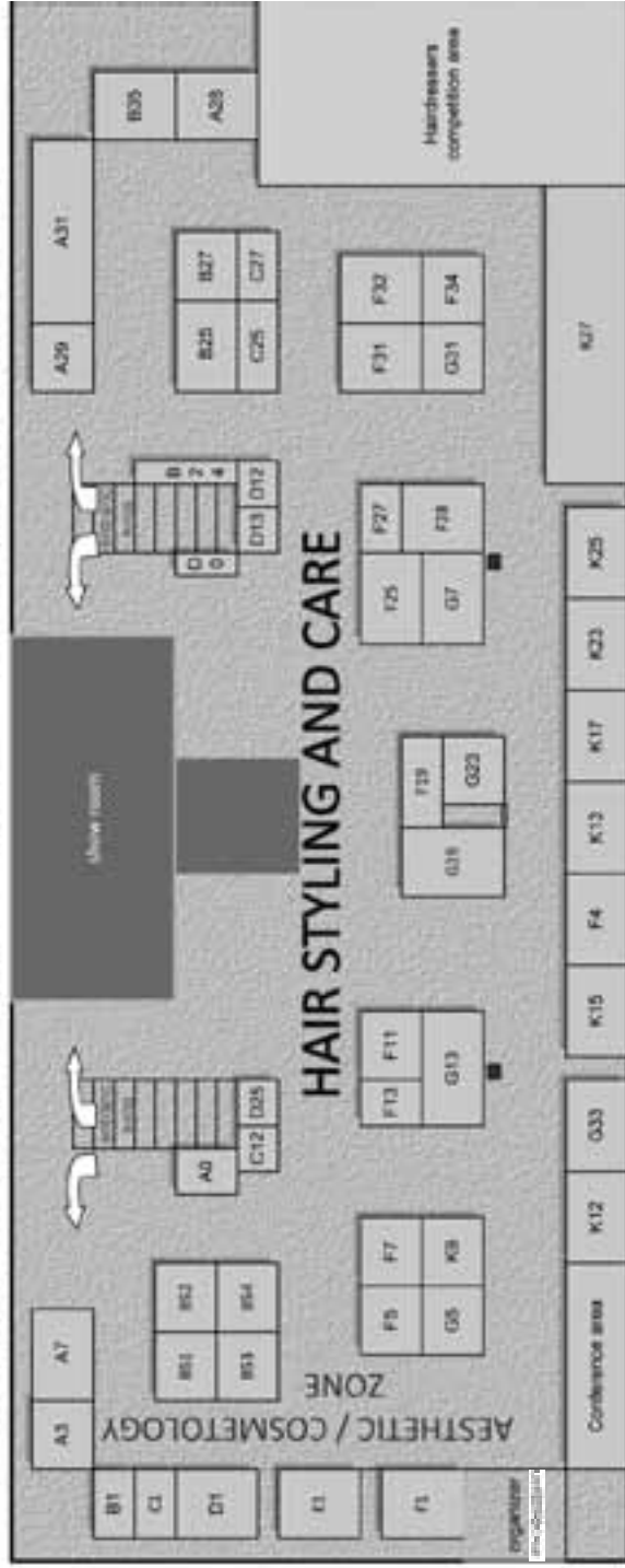
Provisional plan - May, 2016