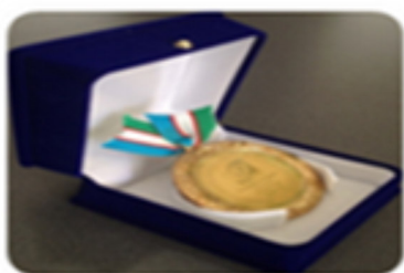
UMAROV- лучший продукт "Тарталетка"

30 ноября, 2017г на официальном приеме по случаю открытия выставки были награждены “золотыми” медалями следующие компании: