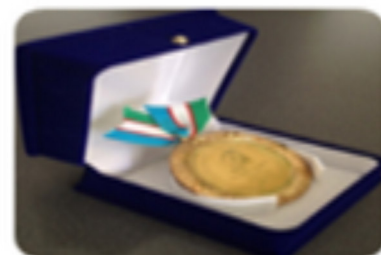
СП «QOVUN DARAXTI» Самый признанный продукт.