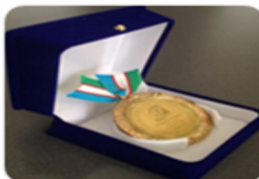
HTI GROUP- Лучшая упаковка